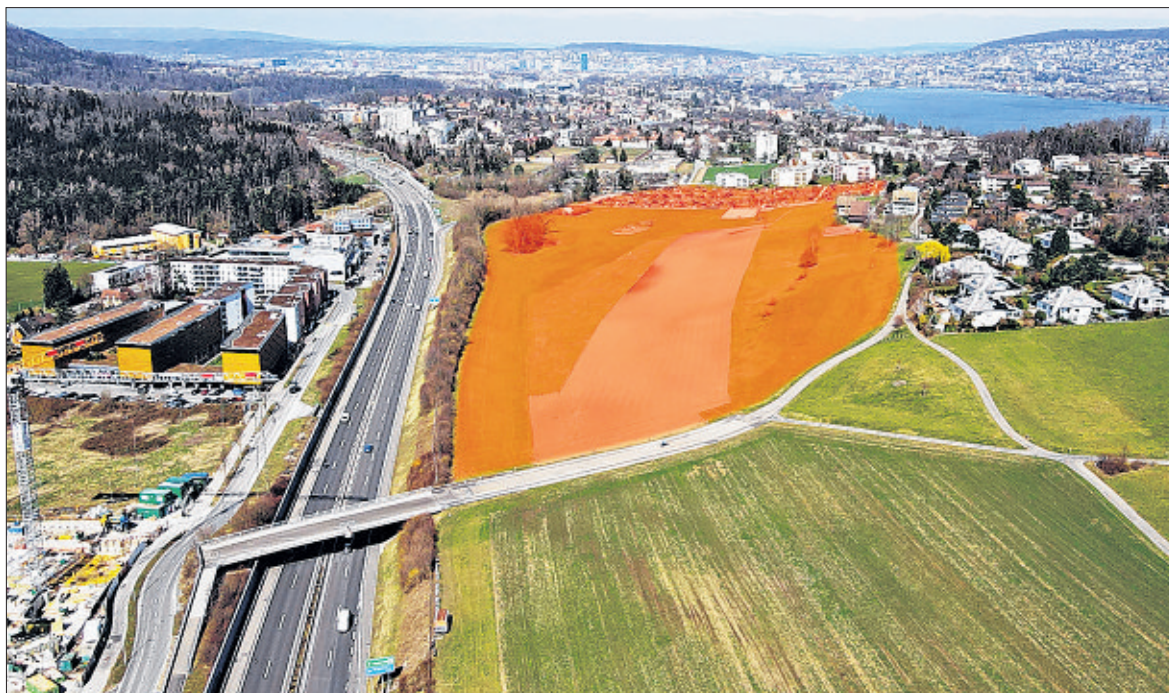
Dieser ganze Abschnitt in Rot würde für eine Mischzone umgezont und bebaut werden.

Darum ergreift die IG entschieden das Referendum und benötigt nun bis zum 27. Juni mindestens 1'000 Unterschriften von stimmberechtigten Bürgern des Bezirks Horgen, zu dem auch Kilchberg gehört. Um das zu erreichen, wird sie einen Flyer an alle Kilchberger Haushalte mit Unterschriftenbogen verteilen. Am Samstag, den 5. Juni, ist zudem eine Aktion vor Ort geplant, die für Aufmerksamkeit in der